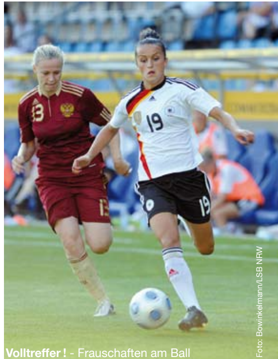
Volltreffer! - Frauschaften am Ball

nerarbeit an. Momentan erarbeitet der Landessportbund ein Projekt, Multiplikatoren auszubilden, die sich speziell um Jungen kümmern. Gender Mainstreaming ist im Landessportbund ein ganz wichtiges Instrument geworden, und alle haben das erkannt.